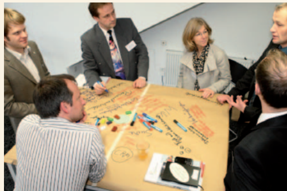
Diskussionsrunde bei Wissen live!