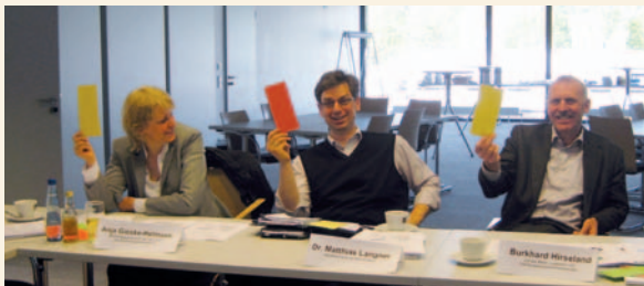
Bewertung eines wissensintensiven Prozesses